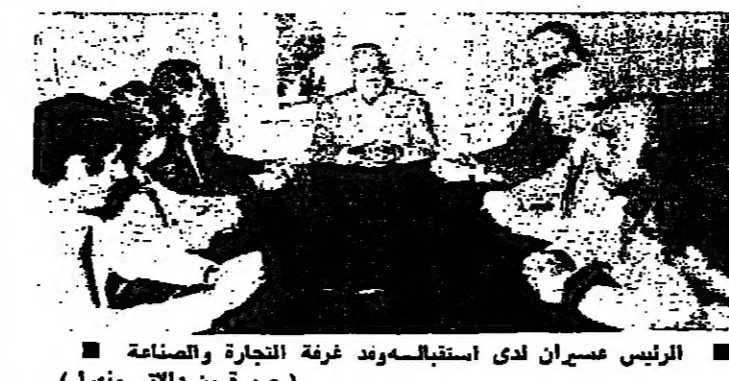
الرئيس عسيران لدى استقباله وفد غرفة التجارة والصناعة

ذكر تقرير مصرفي عن تطور الأوضاع المصرفية خلال الفصل الثاني من العام الجاري، أن ودائع الافراد تراجعت بمعدل ٢٤ مليون ليرة، بينما ازدادت التسليفات ٤,٨ ملايين ليرة. وجاءت هذه الأرقام في تقرير إحصائي أعده الاتحاد العام للصيرفة، الصادر في كانون الثاني من العام الجاري، حول تطور حجم الودائع والتسليفات خلال النصف الأول من العام الجاري، بالمقارنة مع الفترة ذاتها من العام السابق. ورد في التقرير أن حجم ودائع الافراد (التي هي) خلال الأشهر الثمانية الأولى من حزيران من عام ١٩٧٥، قد ازداد بمعدل ٢٤ مليون ليرة، مقابل ٢٧٦ مليون ليرة للفترة ذاتها من عام ١٩٧٤ الماضي، أي بتراجع بلغ ٢٤ مليون ليرة. وهذا التراجع الحاصل في ودائع الافراد، خلال الفصل الثاني، من العام الجاري، كان نتيجة أكبر، بالمقارنة مع الفصل الأول من هذا العام، حيث بلغت الودائع ٥٩٤ مليون ليرة، بينما انخفضت الودائع خلال شهر حزيران فقط ١٤ مليون ليرة.